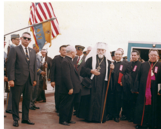
Перша пастирська візита Патріярха Йосифа Сліпого до США. 21 липня 1968 року, міжнародне летовище у Філадельфії

О роде суєтний, проклятий, Коли ти видохнеш? Коли Ми діждемося Вашингтона З новим і праведним законом? А діждемось-таки колись.