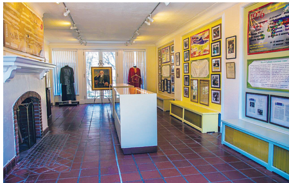
Інтер'єр Музейної кімнати Патріярха Йосифа

4 травня 2014 р., в Домі Товариства «Свята Софія» США (ТСС А), відкрила двері Музейна кімната Патріярха Йосифа Сліпого, що діє під егідою Центру студій спадщини Його Блаженства. Церемонію відкриття провели Президент Товариства «Свята Софія» в Римі о. Марко Ярослав Семенен та Голова ТСС А академік Леонід Рудницький.