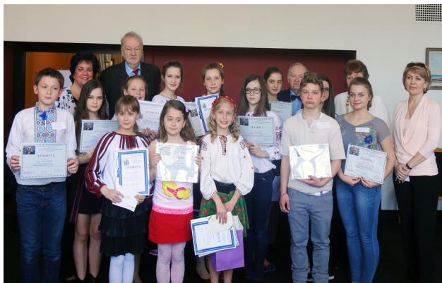
Учасники та члени журі конкурсу

Федеральною Кредитовою Кооперативою «Самопоміч», провели конкурс деклямації «Одна Сибір неісходима...». Метою заходу було не лише відзначити знаменну дату виходу Церкви з підпілля, але й зацікавити молоде покоління стражденною історією Катакомбної Церкви та долею її мучеників. Саме тому Конкурс був організований з думкою про учнів 5-12 клас Нашої Української Рідної Школи у Філадельфії, які – з допомогою учителів та батьків – підготували до цієї події вірші українських материкових та діаспорних поетів: Лесі Храпливої-Щур, Зої Когут, Романа Завадовича, Леоніда Полтави, Василя Яшуна та інших.