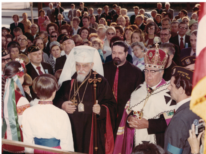
Патріарх Йосиф Сліпий відвідує Церкву Благовіщення Пресвятої Богородиці в Мелровз Парк, ПА, 1973 р.

У 1964 р. голова Ради у справах релігійних культів при Раді Міністрів СРСР О. Пузин у доповіді «Про політику папи Павла VI» представив зрушення у відносинах між Ватиканом і СРСР та наголосив на певному прогресі у ставленні католицьких єпископів до комунізму. Він, зокрема, вказав на відсутність антикомуністичних заяв у доповідях на засіданнях II Ватиканського собору. Однак О. Пузин принагідно зауважив, що важливою проблемою для радянського керівництва залишилося т. зв. «уніятське питання» в середині держави, а на Заході – «Українська Католицька Церква» (УКЦ), яку підживлює активна діяльність української діяспори на чолі з верховним архиєпископом Йосифом Сліпим. За словами радянського чиновника, «антирадянщик Сліпий» поставив собі за ціль відродити УГКЦ і добитися проголошення Київського патріархату з визнанням за ним титулу патріарха, а також він не покинув надії на повернення в УРСР, про що свідчать його щоденні відвідини радянського посольства. У своїй доповіді О. Пузин критикував «толерантне» ставлення папи Павла VI до антирадянської діяльності представників української діяспори і УКЦ. Тому як відповідь на таку позицію папи римського радянській стороні слід, по-перше, призупинити налагодження дипломатичних взаємовідносин з