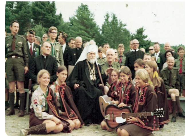
Патріарх Йосиф Сліпий та Преосвященний Йосиф Шмондюк під час візиту на пластовій оселі Вовча Тропа, 1968 р.

З приїздом митрополита Йосифа Сліпого до Риму українці в діаспорі активізували свою інформаційну діяльність. Слід зауважити, що для греко-католиків в Україні було важливо отримувати інформацію про події у «вільному світі». Релігійні новини віруючі Катакомбної Церкви черпали в основному через західні радіостанції, зокрема, «Радіо Ватикан», «Радіо Свобода», «Голос Америки» та ін. У звіті для союзної і республіканської Рад у справах релігій про діяльність «уніятів» від 9 грудня 1969 р. М. Винниченко зауважив, що більшість греко-католиків регулярно слухає радіопередачі української служби «Радіо Ватикан», в окремих селах роблячи це навіть організованими групами. Чимало етерного часу у цих передачах присвячується діяльності Кардинала Йосифа Сліпого: пропагуються плани про створення Українського Католицького Університету та відкриття собору Св. Софії