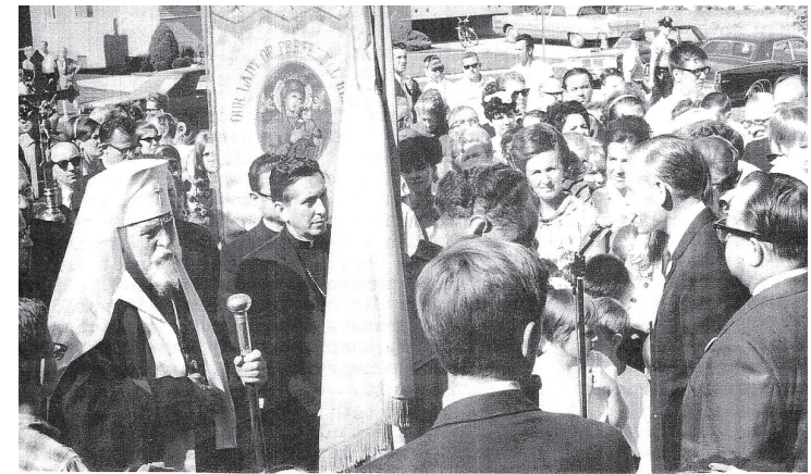
Українська громада Дітройту вітає Блаженнішого Йосифа, 1973 р.

та політику про правдивий стан УГКЦ в СРСР було необхідне, оскільки на Заході все частіше чулися голоси радянської пропаганди про добровільність рішень т.зв. «Львівського собору 1946 р.», звинувачення єпископів і священників у колабораціонізмі в роки II Світової війни, безпідставність звинувачень стосовно релігійних переслідувань у Радянському Союзі тощо [9, с. 283].