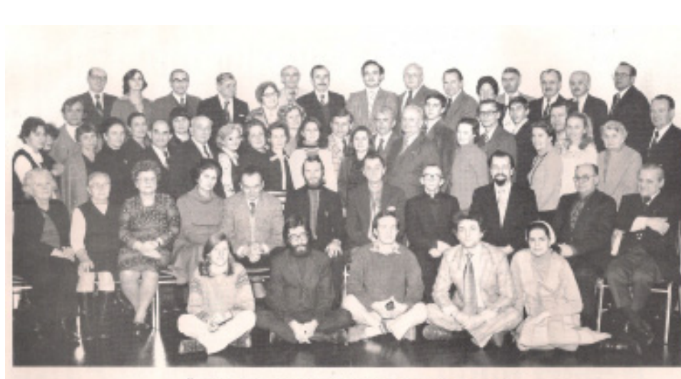
Учасники засідання першого семінару Філії УКУ у Філядельфії, грудень 1977

Коли справа з купівлею Дому у Філядельфії напіткала низку труднощів, Патріярх Йосиф глибоко переживав їх, інтенсивно кореспондуючи із Мирославом та Романом Навроцькими аж до моменту офіційної купівлі будинку. 28 серпня 1976 року: «Дай Боже, щоб Ви вже раз купили Філію у Філядельфії». 20 січня 1977 року: «Сто разів питав я чи дім на Філію у Філядельфії куплено і перебрано в посідання; велика небезпека, що через зволікання можете його стратити». 31 січня 1977 року: «Прохаю перебирати будинок Філії Українського Католицького Університету і продовжувати старання аж до остаточного оформлення акту перебрання». 14 лютого 1977 року: «Мене найбільше цікавить, чи Ви вже переняли дім на Філію у Філядельфії, бо велика небезпека є, що Ви можете те прогавити. Скільки разів, я Вам вже те писав. Процес можете вести далше, але зробіть контракт купна і візьміть в посідання дім, щоби не було запізно». 23 березня 1977 р.: «Архіви, Музей і бібліотеки зберігайте у Філії УКУ у Філядельфії. Я думав, що Ви вже підписали контракт і перейняли дім, а Вам ще п'ять днів до реченця».