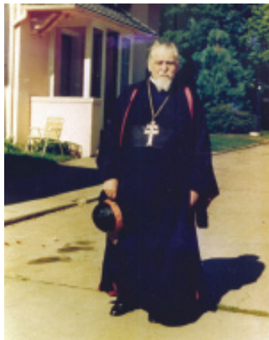
Під час своєї третьої візити до США 1976 року Патріярх відвідав новонабутий будинок Товариства «Свята Софія» у Філадельфії, у якому міститься філія УКУ