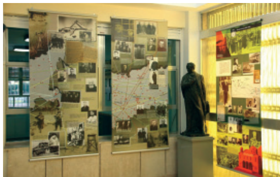
Фрагмент виставки “До Світла Воскресіння крізь терни катакомб”

В неділю, 10 лютого, в рамках святкування, Преосвященний Діонісій (Ляхович), Апостольський візитатор в Італії, відслужив Архиерейську Божественну Літургію в соборі Святої Софії у Римі. У своїй проповіді він наголосив на геройському прикладі Патріярха Йосифа, який повинен надихати нас бути вірними синами і доньками своєї Церкви і народу. Опісля учасники конференції відбули прощу до колишнього монастиря оо. Студитів на Студіоні, що його придбав Патріярх Йосиф, а також до монастиря у Гроттаферрата, де Блаженніший провів перші тижні свого перебування у вільному світі.